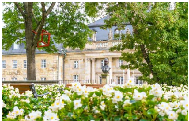
Markgräflisches Opernhaus UNESCO-Weltkulturerbe