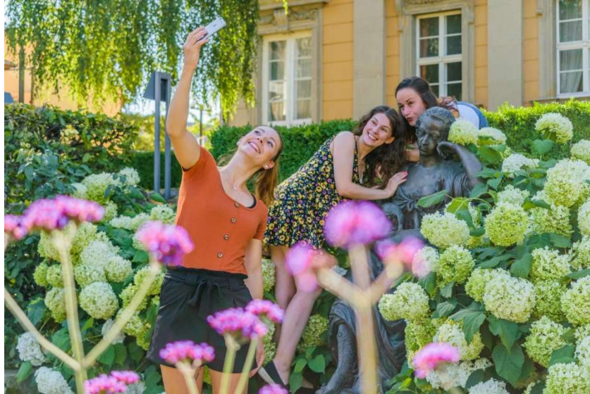
Denkmal Statue Wilhelmine von Bayreuth