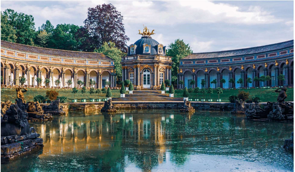
Ermitage Bayreuth

Falls Sie Bayreuth nur wegen der Festspiele kennen: In der hübschen Stadt in Mittelfranken finden Sie mehrere wichtige Sehenswürdigkeiten und historische Stätten, die mit der Markgräfin Wilhelmine von Bayreuth verbunden sind. Dazu gehören das Markgräflische Opernhaus, die Ermitage und das Neue Schloss.