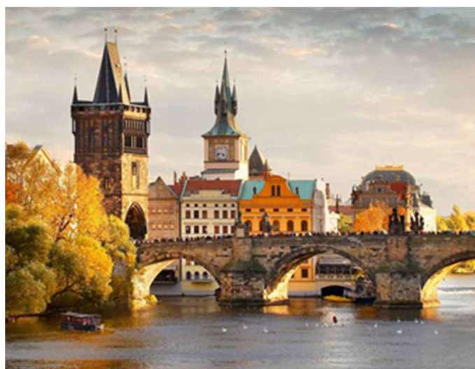
Prager Altstadt mit Moldau