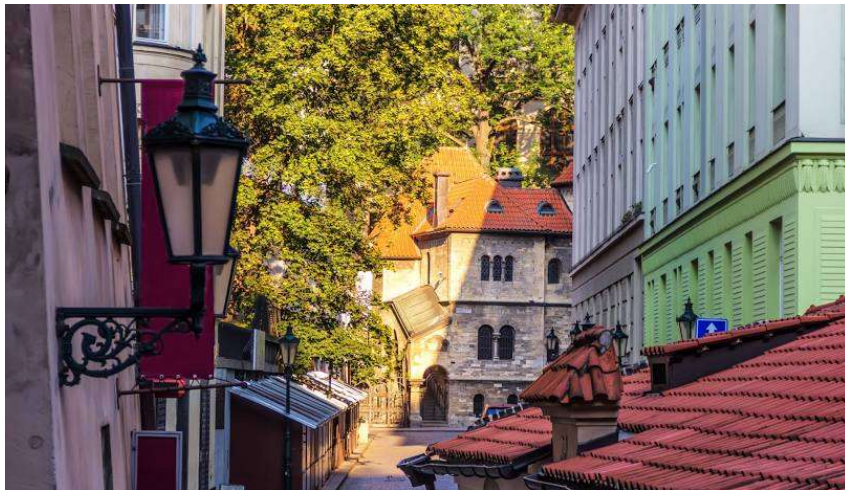
Jüdisches Viertel, Prag

Nach dem Frühstück besichtigen Sie das jüdische Viertel mit einem geführten Spaziergang. Neben der Maisel Synagoge und dem Jüdischen Friedhof besuchen Sie eine Holocaustgedenkstätte, die Pinkas-Synagoge , in der an den Wänden ca. 80.000 Namen jüdischer Opfer von Handschrift verewigt sind. Darüber hinaus beinhaltet die Führung die jüdische Geschichte, die Gründe der 600-Jährigen Diskriminierung der Juden und die Blütezeit des Jüdischen Prags.