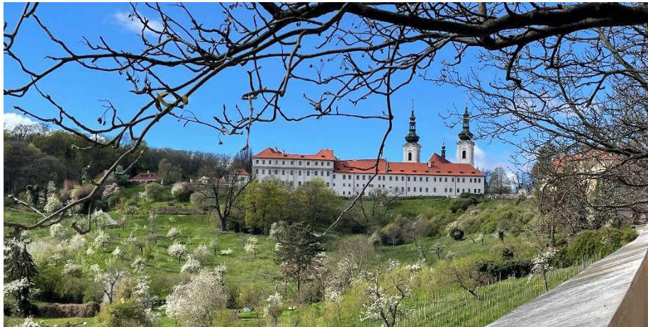
Strahov Kloster mit Prunksälen der Bibliothek

Nach einem kurzweiligen Spaziergang durch die Natur erreichen Sie den Petřín (deutsch Laurenziberg) und fahren mit der Standseilbahn in die Altstadt Prags zurück. Gestalten Sie den Rest des Tages ganz nach Ihrem Gusto und genießen Sie Ihren Abend in Prags Altstadt.